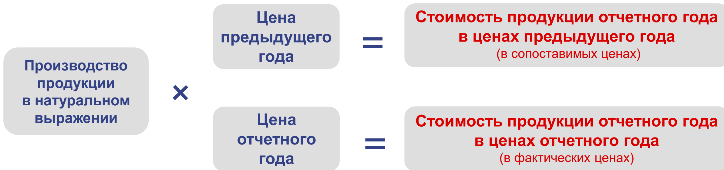
СХЕМА РАСЧЕТА ОБЪЕМА ПРОИЗВОДСТВА ПРОДУКЦИИ СЕЛЬСКОГО ХОЗЯЙСТВА

Для стоимостной оценки продукции сельского хозяйства используются основные цены (фактически действовавшие цены отчетного года и сопоставимые цены предыдущего года).